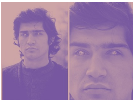
Giuseppe Penone // Rovesciare i propri occhi, 1970

Exils, (en collaboration avec Laurence Bertrand-Dorléac), Paris, RMN, 2012.