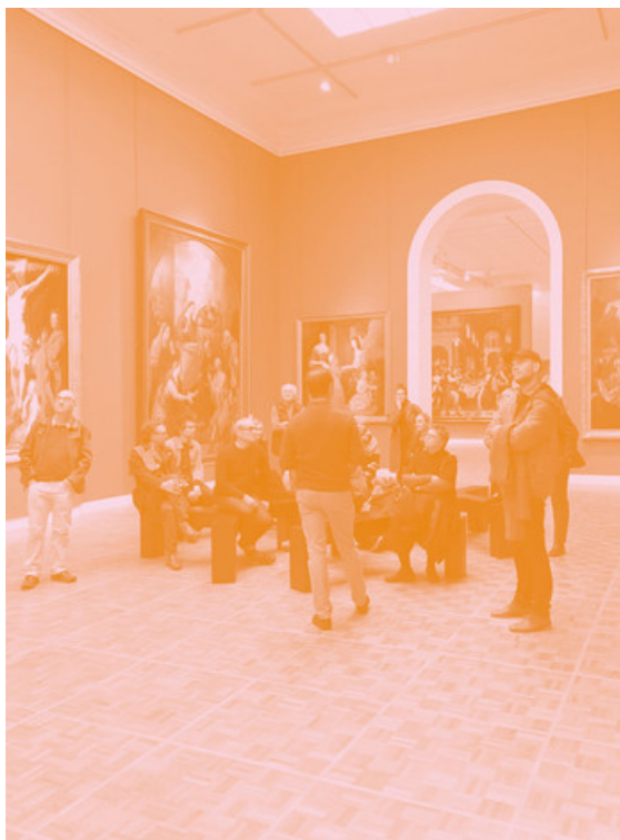
Vue de la salle des retables des XVIIe-XVIIIe siècles, avec Sans titre (Fleury-Mérogis) (2012) de John Cornu, Musée des Beaux-Arts de Rennes

Si "display" est un terme très commun dans la langue anglaise, il a une spécificité intraduisible en français qui en motive son usage dans le domaine de l'art, même si le sens qu'on lui accorde est souvent assez flou. Il nomme le trouble entretenu par les appropriations du geste scénographique par l'artiste, et permet aussi de réhabiliter au sein de l'histoire de l'art une histoire de la scénographie d'exposition méconnue. Dans un aller-retour entre les années 1930-1950 et les pratiques contemporaines, nous réfléchirons aux manières de faire de l'exposition un espace de cohabitation et d'hospitalité où les aspects techniques de l'espace participent du lieu de l'oeuvre, et où l'oeuvre prend le risque du déplacement.