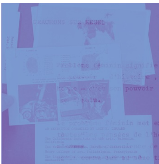
Auteur : lippard lonzi